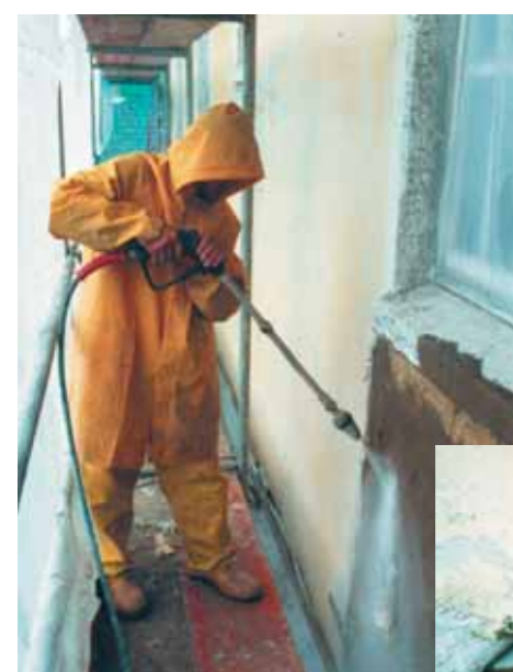
Entfernung elastischer Anstriche mit TURBOFRÄSER-Düse und heißem Hochdruck-Wasser

Der POWERTRAILER besitzt einen Edelstahl-aufbau und eine weit öffnende Schutzhaube mit zusätzlicher Heckklappe. Diese Heckklappe erlaubt den einfachen Zugang zu den Bedienungs- und Kontrollelementen. Hier sind Spritzlanze und Schlauchtrommeln untergebracht, ebenso Einfüllstutzen für Heiz- und Dieselöl. Ihren festen Platz finden hier: optionale Arbeitsdüsen, Wasser-Vorfilter und Arbeitskleidung.